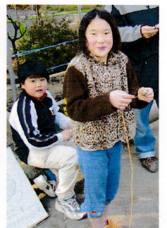
まわせちゃったのダ